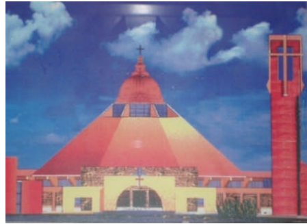
ትስራሕ ዘላ ቤተ ክርስቲያን ቅ. ሚካኤል ከረን

መስዋዕቲ ቅዳሴ፡ እወ፡ ክቡር ስጋን ደምን ኢየሱስ ክርስቶስ ጎይታናን ኣምላኽናን እንስውኣሉ፡ ኣብ ዳስ፡ ኣብ ጸሓይ፡ ኣብ ደሮና ኮይኑ ኣሎ። ደጊም ይኣክል ንበል ሓቦ ንግበር ኣብ ዝቀረበ እዋን ክትውዳእ ኩልና ንተዓጠቅ።