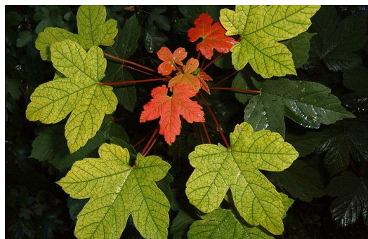
ኣሻ ካና ማለናኹ